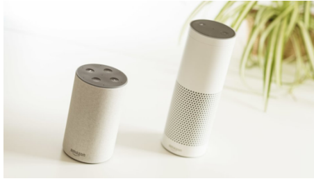
Ilustración: Amazon Echo segunda generación (en frente) y la primera generación (atrás) comparación).

Además, Echo Plus está disponible desde el 10/2017 en Europa. Se parece al Echo de primera generación en el exterior, pero puede hacer mucho más, especialmente en el sector del Smart Home. Describiré más sobre esto más adelante. El Echo Plus se ve muy similar a la primera generación, pero en concreto tiene la ventaja de que sirve de „puente” hacia otros productos Smart Home.