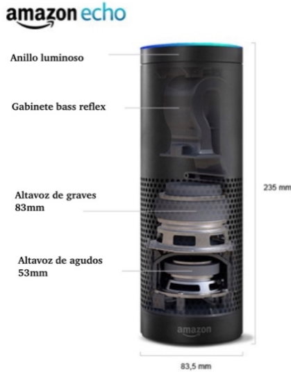
Ilustración: Amazon Echo

El Echo de la primera generación se puede ver aquí en la sección transversal: