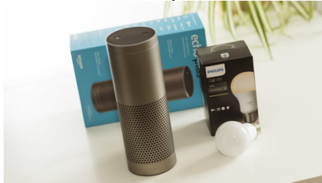
Ilustración: Amazon Echo Plus junto con la lámpara Philips Hue (promoción limitada)

Además, Echo Plus está disponible desde el 10/2017 en Europa. Se parece al Echo de primera generación en el exterior, pero puede hacer mucho más, especialmente en el sector del Smart Home. Describiré más sobre esto más adelante. El Echo Plus se ve muy similar a la primera generación, pero en concreto tiene la ventaja de que sirve de „puente” hacia otros productos Smart Home.