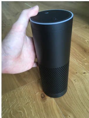
Ilustración: Mi Amazon Echo

Con Echo, puedes hablar con Alexa y darle tus comandos de voz, lo que anteriormente tenías que escribir a través de un teclado.